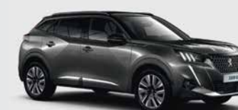
Γκρι Platinum μεταλλικό