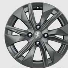
Ζάντα αλουμινίου 16" ELBORN