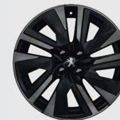
Ζάντα αλουμινίου 18" EVISSA με βερνίκι Μαύρο Mist και ένθετα Μαύρο Onyx