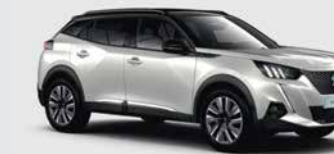
Λευκό Nacré perlé μεταλλικό τριπλής επίστρωσης