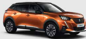
Πορτοκαλί Fusion μεταλλικό