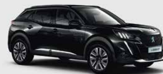
Μαύρο Perla Nera μεταλλικό