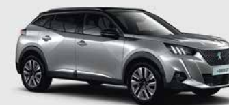
Γκρι Artense μεταλλικό