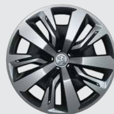
Ατσάλινη ζάντα 16" NOLITA

(2) Διαθέσιμες στο βασικό, τον προαιρετικό εξοπλισμό ή μη διαθέσιμες, ανάλογα με την έκδοση.