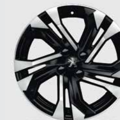
Ζάντα αλουμινίου 17" SALAMANCA