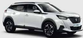
Λευκό Banquise παστέλ

(1) Χρώματα διαθέσιμα ανάλογα με την έκδοση.