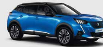
Μπλε Vertigo μεταλλικό τριπλής επίστρωσης