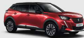
Κόκκινο Elixir μεταλλικό έγχρωμης επίστρωσης