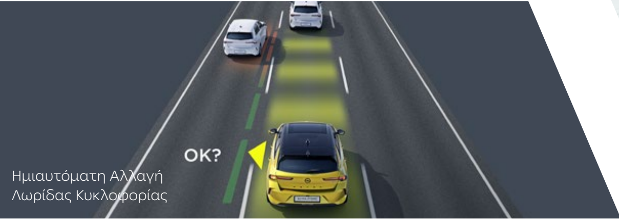
Ημιαυτόματη Αλλαγή Λωρίδας Κυκλοφορίας