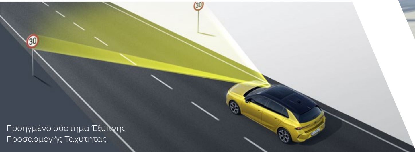
Προηγμένο σύστημα Έξυπνης Προσαρμογής Ταχύτητας